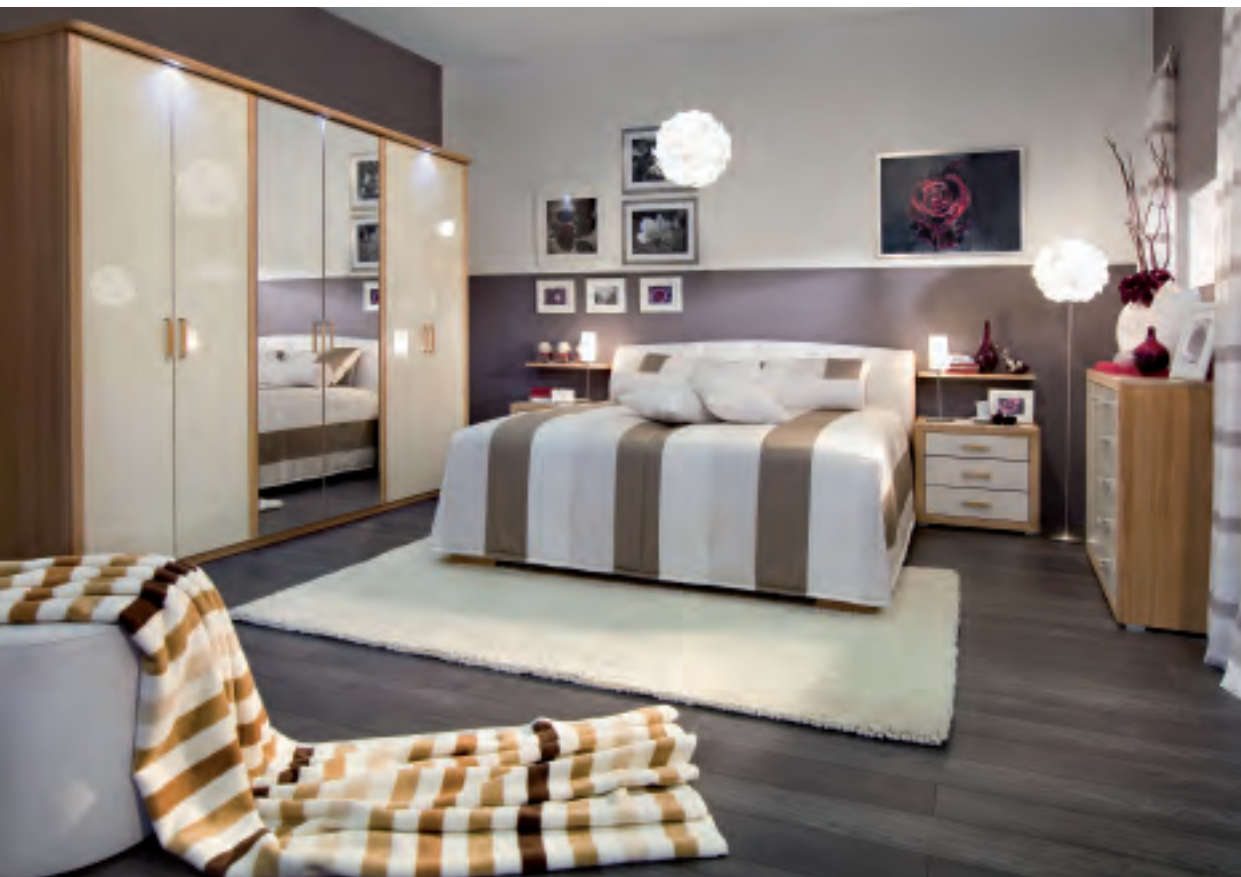
bild. Wer es lieber zeitlos mag, ist mit „Castell“ gut beraten. Ein Bett in 60 cm Höhe sowie Solitäre in Kernbuche mit Hochglanz Creme, schaffen eine wohnliche Atmosphäre in schlichter Eleganz.

Trendsetter für Stilexperten ist „Villa“. Der Liegekomfort wird durch ein Lattenrost, im Kopfteil vierfach verstellbar und im Fußbereich aufklappbar, verbessert. Das Schrank-System in der Standardhöhe 220 cm mit LED-Beleuchtung im Schubkastenelement schafft Übersicht in der Lade. Last but not least besticht „Studio“ durch Funktionalität im Lifestyle-Look. Der kubische Bettkas-