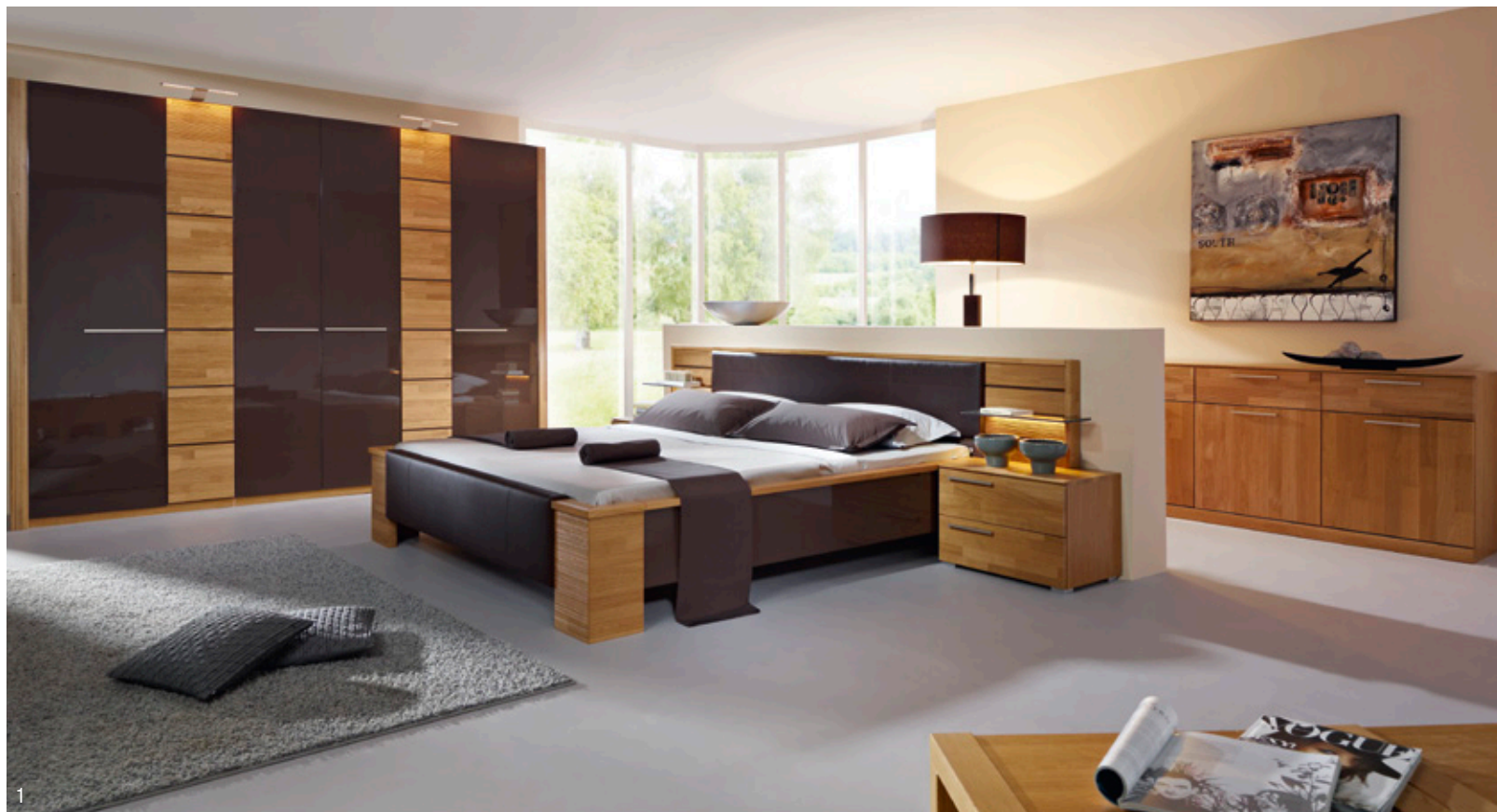
1 | Programm „Kendra“ gefällt mit seiner klaren Formensprache und eleganten Linienführung.

Rauch überzeugt mit zwei neuen Modellen aus der aktuellen Steffen-Kollektion | Neue Programme